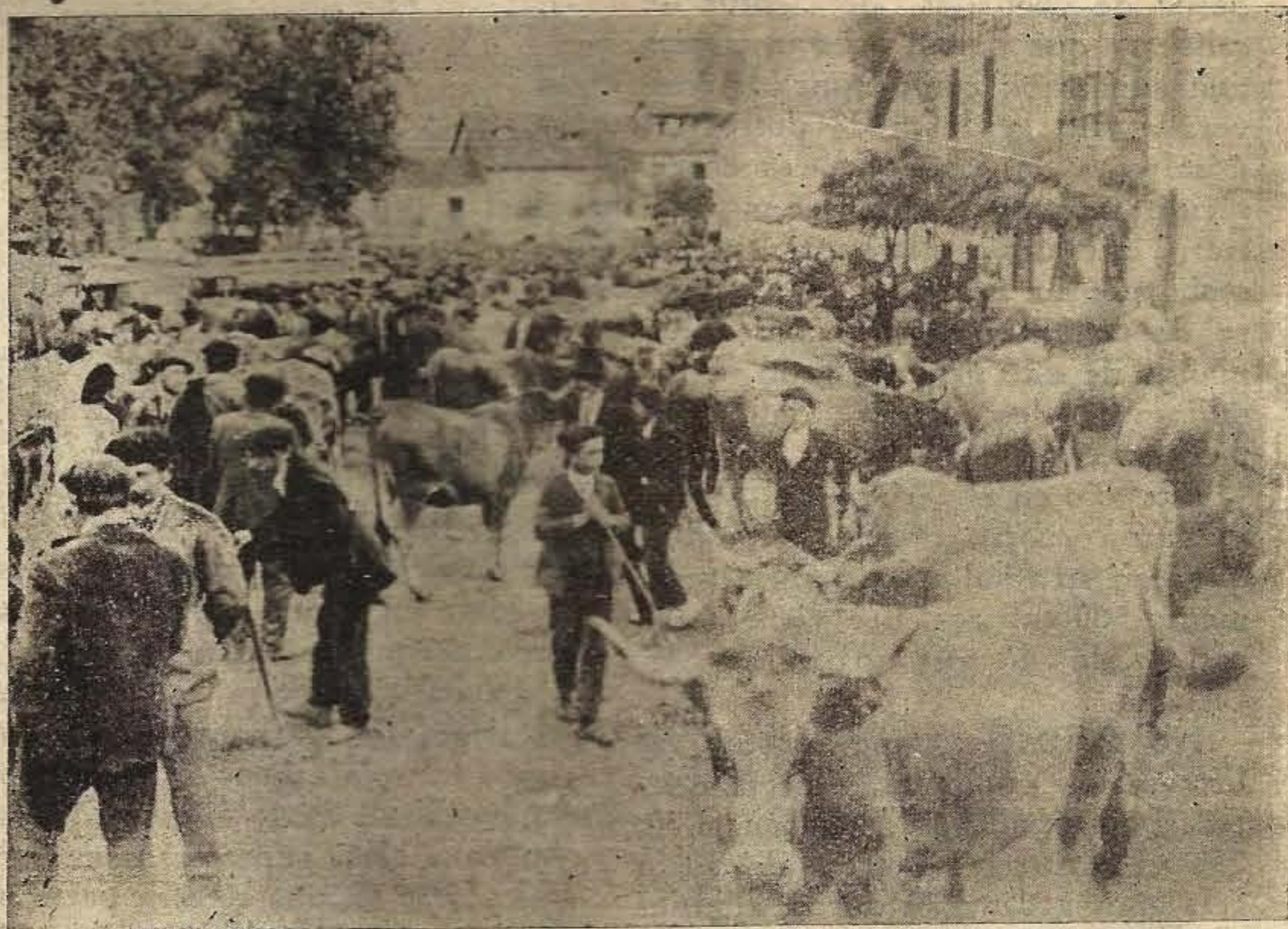
Vista parcial de La Serna durante las ferias de los Santos

Novillos de dos años a 1.800, 1.900 y 2.000 reales. Los de tres años a 2.300 y 2.400 reales, también tuvieron salida.