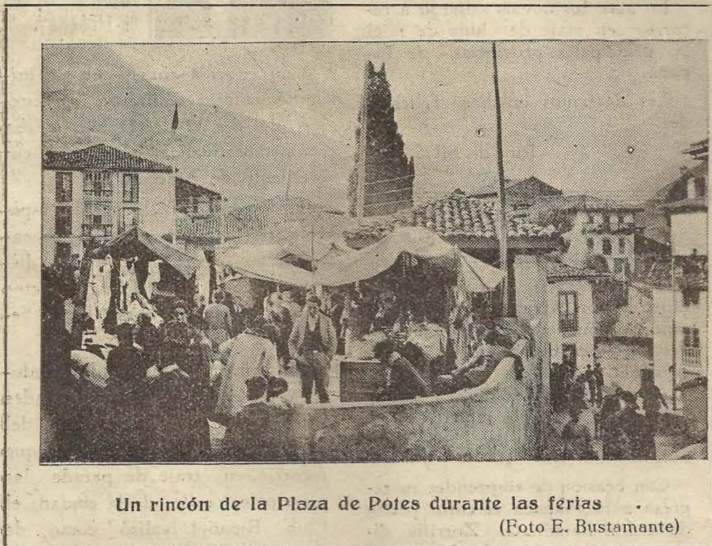
Un rincón de la Plaza de Potes durante las ferias