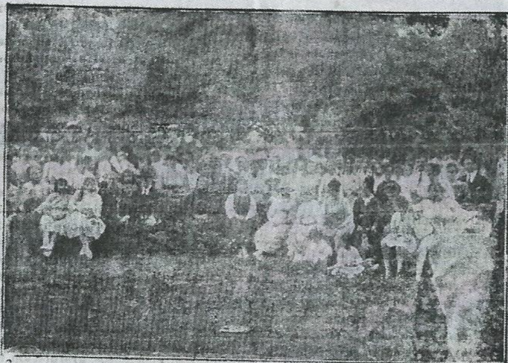
Grupo de concurrentes a la fiesta lebaniega en Buenos Aires.