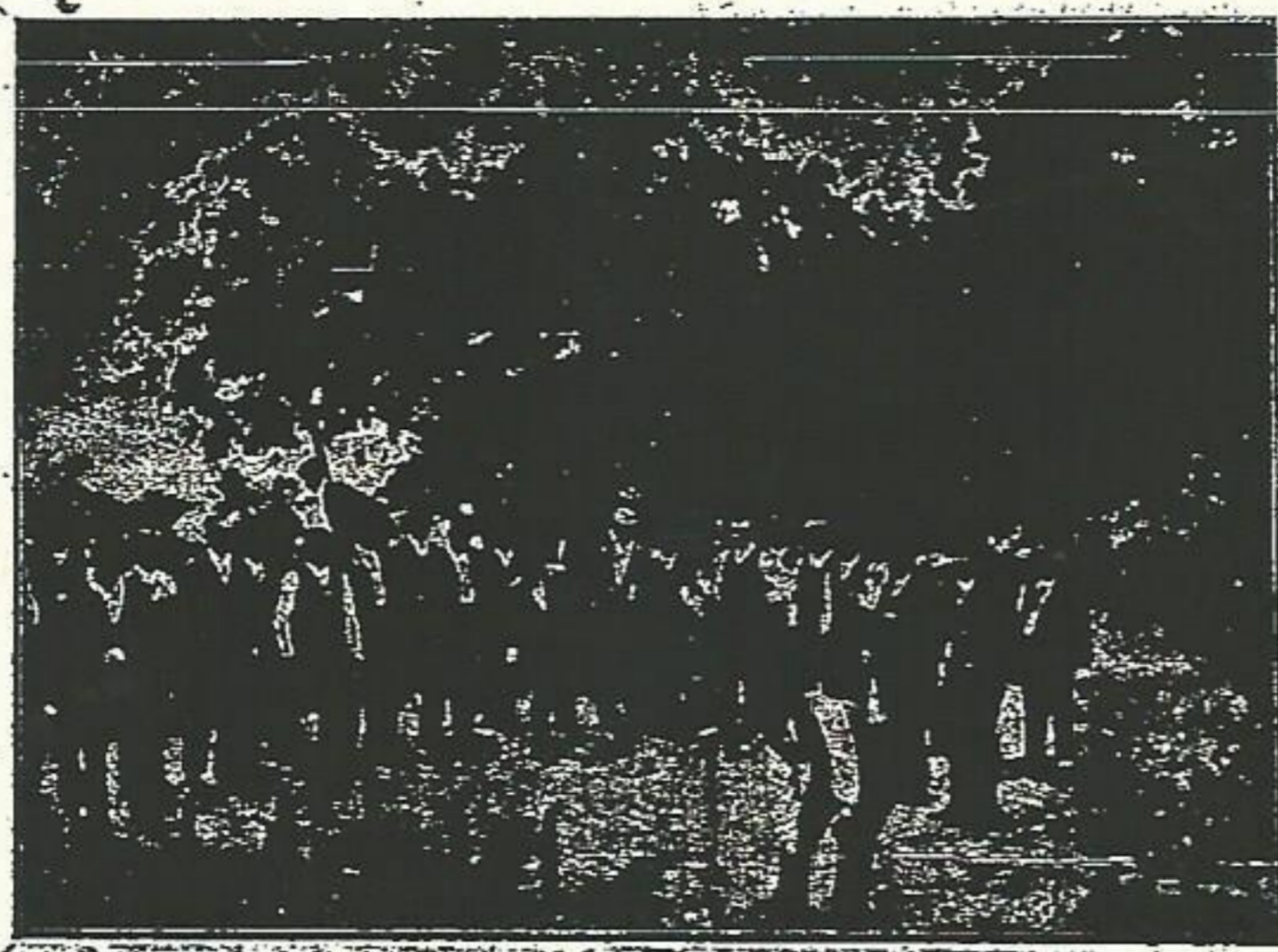
Jugadores de bolos en la bolera de San Miguel, Bedoya.